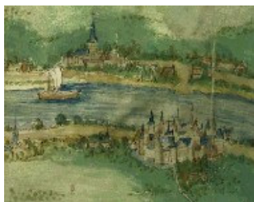
Schoonhoven en Nieuwpoort (Pieter Crabeth, 1520)

De website van de SHHV is via twee adressen bereikbaar: www.shhv.info en sinds kort ook via www.heemtijdinghen.nl . Recent zijn ook enkele nieuwe links toegevoegd.