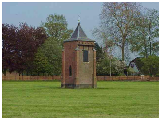
De duiventil uit de 18 e eeuw

Deze film over het dorpsleven in Harmelen is door de heer Dirks gerestaureerd en voorzien van begeleidende muziek. De laatste jaren is de film enkele malen getoond op de Open Monumentendag in Harmelen en was hij opgenomen in het programma van het cursusproject. U kunt thans deze film bestellen op DVD of videoband.