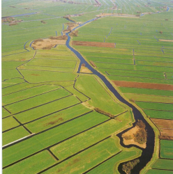
Oude Meije bij Zegveld