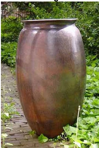
tombak vaas uit het Woerdense gemeentemuseum

De tentoonstelling over de Woerdense metaalkunstenaar Jan Kriege (1884-1944) in het museum Boymans van Beuningen in Rotterdam is verlengd tot en met 29 januari 2006. Aanvankelijk zou de tentoonstelling openblijven tot half december. Maar de belangstelling bleek dermate groot, dat is besloten tot een verlenging. Het museum is te vinden aan het Museumpark 18 – 20, 3015 CX Rotterdam en is geopend van dinsdag t/m zondag van 11.00 tot 17.00 uur. De toegangsprijs voor het gehele museum is € 8,00. Diverse kortingskaarten zijn geldig.