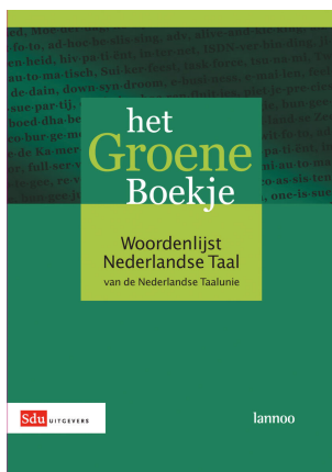
het nieuwste groene boekje