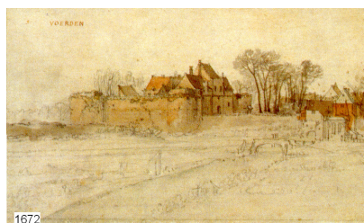
Het kasteel in 1672