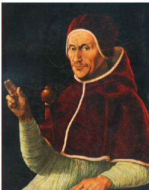
Paus Adrianus VI