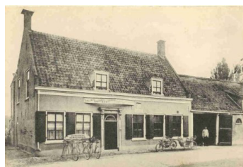
Herberg en Rechthuis "het Wapen van Harmelen"