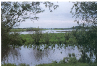
zo was het hier vroeger

op: Donderdag 24 januari 2008 van 20.00 - 22.00 uur.