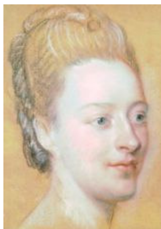
Belle van Zuylen (Portret door Quentin de la Tour, 1766)