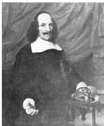
Joan Blaeu ( ca. 1640)