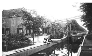
Wetering in zuidelijke richting

op: Dinsdag 8 juli 2008 van 20.00 – 22.00 uur.