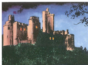
De Rode Ridder

op: woensdag 27 augustus 2008 om 20.00 uur in: De Dam, Wilhelminaweg 79, 3441 XB Woerden