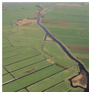
De Grecht bij Kamerik/Zegveld