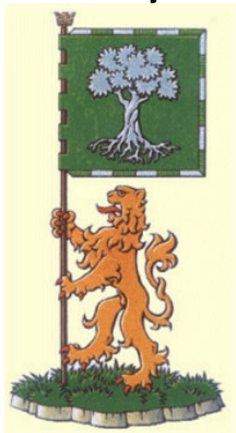
NGV, afdeling Heraldiek

De Nederlandse Genealogische Vereniging (NGV) houdt zich bezig met stamboomonderzoek. Onderzoek naar voorouders blijkt zich te verheugen in toenemende belangstelling. De NGV is een landelijke vereniging met ca. 10.000 vrijwilligers die elkaar helpen met stamboomonderzoek.