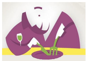
De Smaak van Woerden

Diner op: Woensdag 8 juli 2009 van 17.45 – 19.45 uur