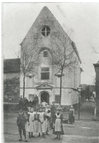
Commanderij van St. Jan Montfoort