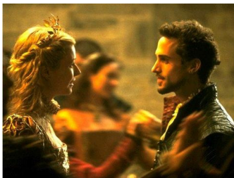
Gwyneth Paltrow en Joseph Fiennes

Tijdstip film: 20.00 – 22.30 uur in: De Dam, Wilhelminaweg 79, 3441 XB Woerden