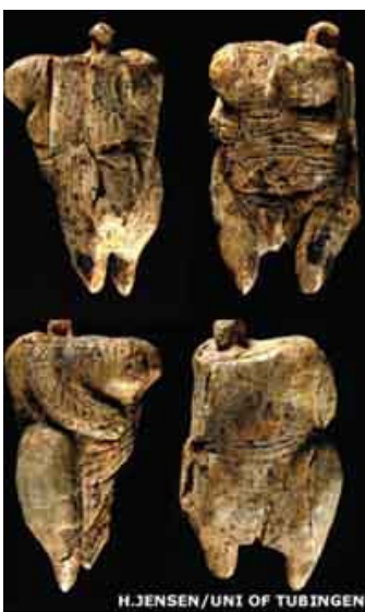
Venus uit Hohle Fels (ruim 35.000 jaar oud)

Recent werd in de pers aandacht besteed aan een prehistorische vondst in Zuid-Duitsland. In het opgravingsgebied in de Schwäbische Alb ten noorden van de Donau worden al sinds 1974 systematisch opgravingen gedaan. Het gaat om een slechts 6 cm groot beeldje van mammoetivoor. Het lijfje, waaraan de linkerarm en schouder ontbreken, is ingekerfd met ornamentale lijnen die wat weg hebben van een kledingstuk. Deze vrouwenfiguur is minstens vijfduizend jaar ouder dan de Venus van Willendorf - de beroemdste rondborstige prehistorische dame, die toevallig een eeuw eerder werd gevonden (in 1908) - en de oudste menselijke beeltenis die we kennen. Opvallend is dat, evenals bij andere beeldjes en afbeeldingen van iets latere tijd, veel aandacht wordt besteed aan de vrouwelijke vorm, maar dat het hoofd ontbreekt. Verder is merkwaardig dat zo vroeg in de Oude Steentijd alleen in Europa dergelijke beeltenissen worden aangetroffen. Het is een fel debat in de wetenschap: waarom vinden we ze niet ook in Afrika, waar de moderne mens toch zo'n 200 duizend jaar geleden is ontstaan?