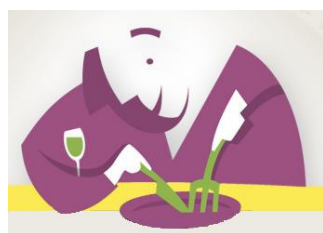
De Smaak van Woerden

Diner op: Woensdag 8 juli 2009 van 17.45 – 19.45 uur In: De Smaak van Woerden, Havenstraat 10a, 3441 BJ Woerden