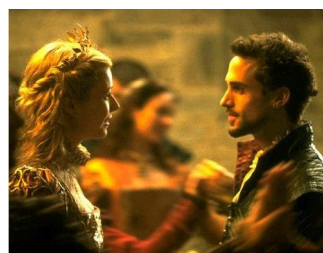
Gwyneth Paltrow en Joseph Fiennes

In verband met de voorbereidingen wordt u gevraagd per e-mail ( administratieshhv@planet.nl ) of telefonisch (0348-44 43 31, b.g.g. 0348-43 10 63) uw deelname aan het diner door te geven vóór 3 juli 2009 . Na afloop van het diner wandelen we naar de Dam, waar aansluitend de film zal worden vertoond.