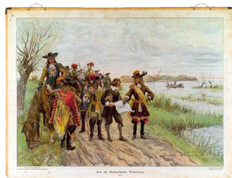
Prins Willem III bij de Hollandse Waterlinie

Opening op: woensdag 19 mei om 17.00 uur