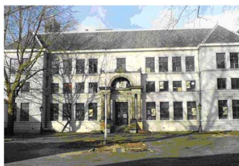
Het voormalige Gerechtsgebouw aan de Hamburgerstraat

op: Zaterdag 29 mei 2010 van 12.53-17.06 uur verzamelen om 12.30 uur in de hal van Station Woerden.