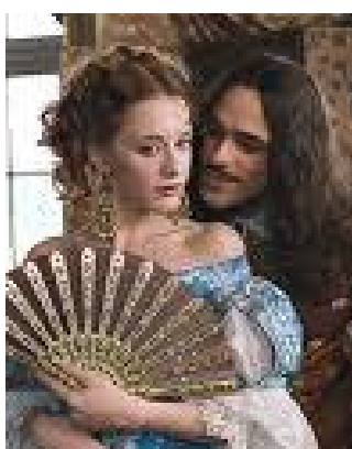
Een scene uit de film