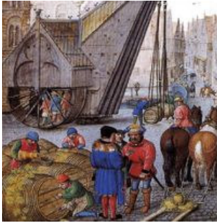
Hanzestad in de 15 e eeuw