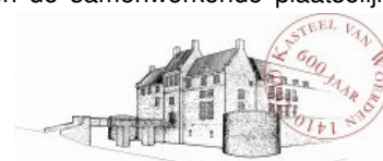
STICHTING HET KASTEEL VAN WOERDEN

En slotte mag niet onvermeld blijven dat we in deze week ook het 600-jarig bestaan van het Woerdense Kasteel vieren. Wij hopen dat u in het grote aanbod iets van uw gading vindt.