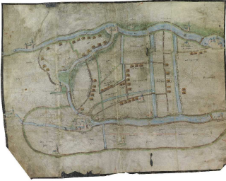
archief Hoenkoop, 15 e eeuw

op: Donderdag 17 maart 2011 van 20.15-22.00 uur In: De Dam, Wilhelminaweg 79, 3441 XB Woerden