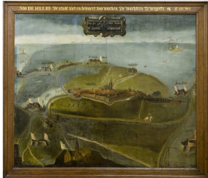
Woerden, anoniem, ca 1575 (eigen bezit Stedsmuseum)

De Conste van Geometria . Vijf eeuwen cartografie in het Land van Woerden