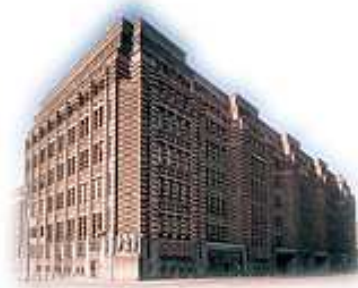
Het Bazelgebouw (Amsterdamse archief aan de Vijzelstraat)

op: zaterdag 25 februari 2012 van 12.30-18.00 uur We verzamelen om 12.15 uur in de hal van het station Woerden (noordzijde)