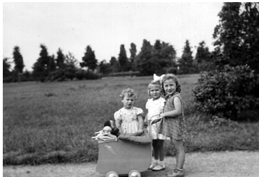
Kinderen Hes in 1939 Een van de foto's op de tentoonstelling in het Amsterdams archief

Er is in die periode ook een tentoonstelling getiteld In Memoriam, De gedeporteerde en vermoorde Joodse, Roma en Sinti kinderen 1942 – 1945 . De toegang voor deze tentoonstelling is gratis.