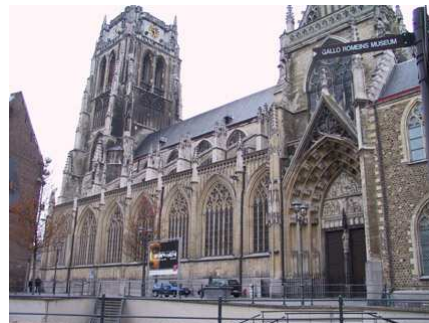
Onze Lieve Vrouwe -basiliek