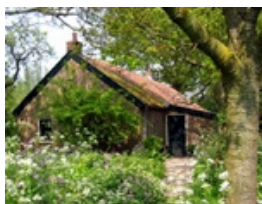
Daggelderhuisje De Kievit in Harmelen

op: dinsdag 30 oktober 2012 van 20.00-22.00 uur In: 't Trefpunt, Iepenlaan 2, 3481 XA Harmelen