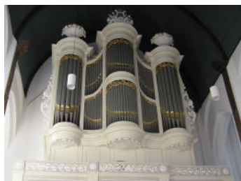
"Kam en van der Meulen"-orgel uit 1840

op: zaterdag 13 oktober 2012 van 20.15-22.00 uur In: Grote of St. Michaelskerk, Noorder Kerkstraat 1, Oudewater