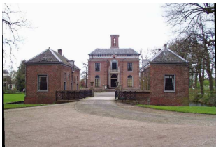
Gunterstein in 2012

op: vrijdag 31 mei 2013 van 13.30 - 17.00 uur Vertrek: Parkeerterrein aan de Houttuinlaan (nabij zuidzijde station Woerden) Alleen voor SHHV-leden; maximaal 20 deelnemers op volgorde van aanmelding