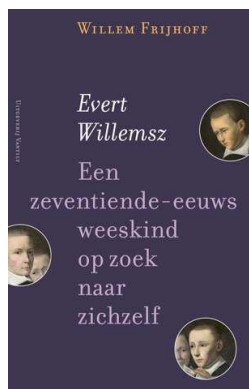
Boek over Bogardus