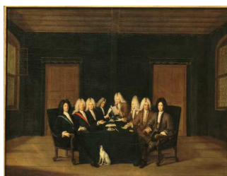
De onderhandelaars bijeen

op: donderdag 23 mei 2013 van 20.00 - 22.00 uur In: De Ridderzaal van het kasteel , Kasteel 3, 3441 BZ Woerden