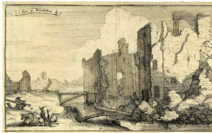
Ruïne Gunterstein na de verwoesting door de Franse troepen in 1672