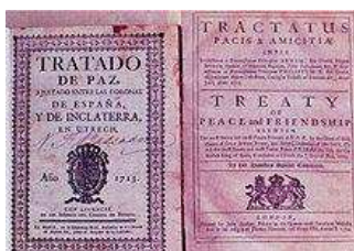
titelblad van het traktaat

In april 1713 werd in Utrecht een serie traktaten gesloten die een generatie van oorlog voeren afsloot, en een volgende generatie vrede bracht. De vrede kwam pas tot stand na ruim een jaar onderhandelen. In deze lezing zal eerst in vogelvlucht een beeld worden gegeven van de Spaanse Successieoorlog (1702-1713) en de Vrede van Utrecht, zowel in Europa als in de rest van de wereld. Thema's als internationale betrekkingen, slavenhandel, maritieme en continentale oorlogvoering, religie, publieke opinie en diplomatie komen daarbij aan de orde. Daarna zal de focus zijn op de vrede van Utrecht als diplomatiek evenement: tientallen diplomaten kwamen samen die 15 maanden onderhandelden en met hun gevolg de stad vulden. Nadat de vrede van Utrecht werd gesloten volgden talloze feesten, en reflecteerden pamfletschrijvers, tekenaars, journalisten en kroniekschrijvers op de gebeurtenissen, maar ook later werd de Vrede van Utrecht met name in deze provincie nog herdacht. De vrede van Utrecht als evenement in de tijd zelf en in latere terugblikken staat centraal in de tweede helft van deze lezing.