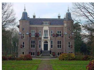
Huis te Linschoten, thans