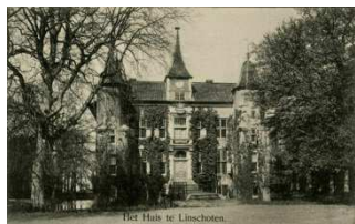
Huis te Linschoten, ca 1915