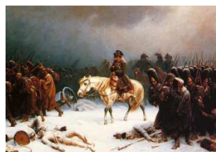
Napoleons terugtrekking uit Moskou