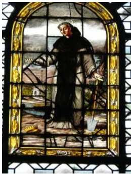
Adelhard als tuinman, St. Sulpice, Parijs (1860)

Beiden verbleven langere tijd in ballingschap. Merkwaardigerwijs overkwam hun biograaf Radbertus hetzelfde: rond 850 werd hij afgezet als abt van Corbie.