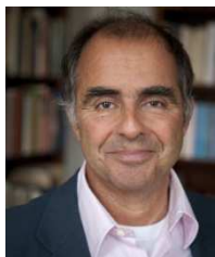
Prof.dr. F. van Oostrom

Frits van Oostrom is sinds 2002 universiteitshoogleraar te Utrecht. Daarvoor was hij twintig jaar lang hoogleraar oudere Nederlandse letterkunde te Leiden en gasthoogleraar aan Harvard University. Hij won zowel de AKO literatuurprijs als de Spinozaprijs, de belangrijkste Nederlandse wetenschappelijke onderscheiding. Daarnaast was hij onder meer voorzitter van de commissie die de Canon van Nederland ontwierp en president van de Koninklijke Nederlandse Akademie van Wetenschappen. Eerder verschenen van zijn hand onder meer Maerlants Wereld en Stemmen op Schrift .