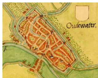
Oudewater, ca. 1558 (Jacob van Deventer)