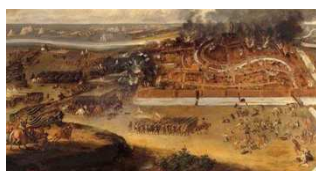
De Oudewaterse moord in 1575 (Dirk Stoop 1650)