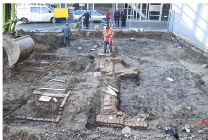
Fundamenten uit de Middeleeuwen, (foto RAAP).

Aan het eind van een koude winterdag in januari 2012 slaat de metaaldetector heftig uit in de werkput aan de Hoge Woerd: het signaal komt van een langwerpige roestklomp, begraven in de bodem. De vinder kan zijn ogen niet geloven: hij denkt direct aan een zwaard. Toch houden de archeologen er rekening mee dat de roest wellicht maar een flinke deurscharnier verbergt. Dat er iets heel bijzonders is opgepiept aan de Hoge Woerd, blijkt als specialisten van Restaura de vondst onder handen nemen. Op röntgenfoto's is onder de dikke roestaanslag een versierd zwaard te zien.