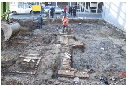
Fundamenten uit de Middeleeuwen, (foto's RAAP).

Aan het eind van een koude winterdag in januari 2012 slaat de metaaldetector heftig uit in de werkput aan de Hoge Woerd: het signaal komt van een langwerpige roestklomp, begraven in de bodem. De vinder kan zijn ogen niet geloven: hij denkt direct aan een zwaard. Dat er echt iets heel bijzonders is opgepiept aan de Hoge Woerd, blijkt zodra specialisten van Restaura de vondst onder handen nemen. Op röntgenfoto's is onder de dikke roestaanslag een versierd zwaard te zien. Een absoluut unieke vondst!