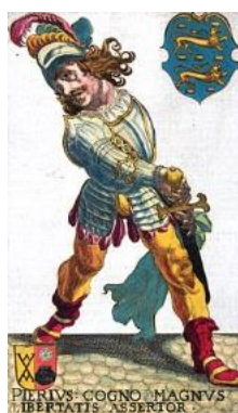
Grutte Pier alias Pier Gerlofs Donia

Het is een van de vele blijken van waardering die hem ten deel zijn gevallen. Ik prijs mij gelukkig hem persoonlijk te kennen. Bladerend in zijn deel 3 kwam ik op het idee om eens na te lezen wat nu het nieuws van 1517 bepaalde. De winter bleek lang en koud, waarbij de Zeeuwse stromen en de Zuiderzee deels bevroren raakten. De lente blijkt grillig en nog op 25 april valt er een pak sneeuw. Eind mei verschijnt een prachtige komeet aan de hemel terwijl de nog jonge Karel V op reis naar Spanje in een storm verzeild raakt. Het schip strandt op de barre kust van Asturië.