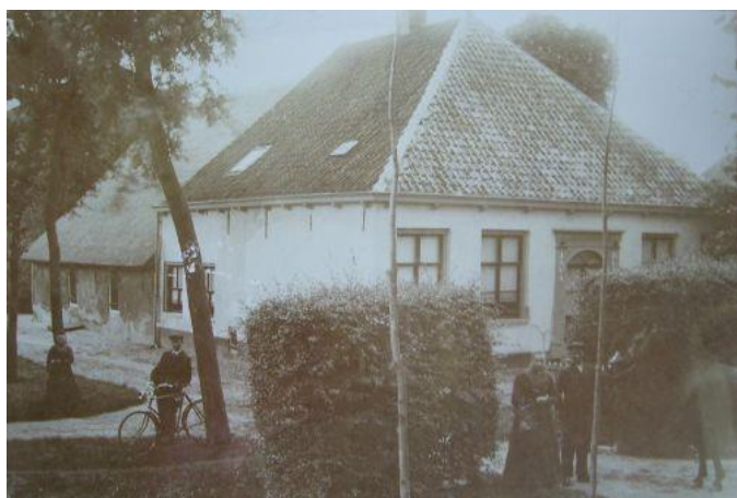
Buitenplaats Javarust bij Bodegraven circa 1910