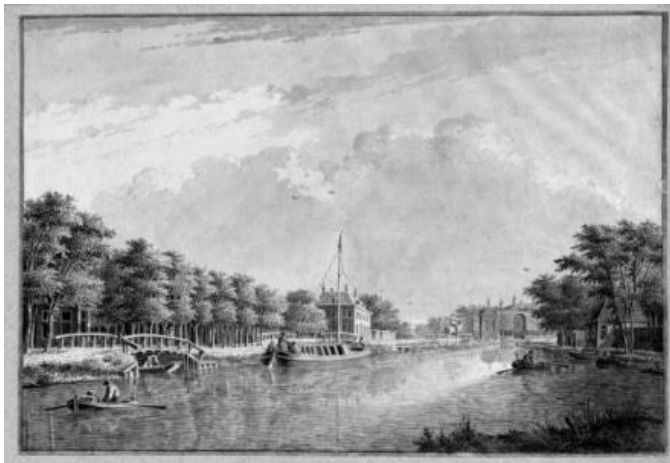
Buitenplaats Oog in Al bij Utrecht in ca. 1760

Met hun aankopen van buitenplaatsen vertraagden ze het sloopproces dat in die tijd in andere buitenplaatslandschappen, zoals de Vecht, juist tot een scherpe daling van het aantal buitens leidde. Paradoxaal genoeg waren het diezelfde kleifabrikanten die de sloop ook juist versnelden. Veel van de buitenplaatsen lagen namelijk op goede kleigronden die in tegenstelling tot de agrarische graslanden nog niet waren afgegraven. De waarde van die ondergrond werd na 1750 al snel groter dan de opstal.