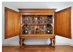
Mini-bibliotheek in Meermanno

op: maandag 3 februari 2014 van 20.00 - 22.00 uur In: De Ridderzaal van het Kasteel, Kasteel 3, 3441 BZ Woerden