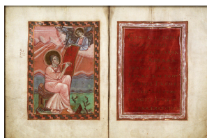
Een topstuk uit de collectie van de Koninklijke Bibliotheek