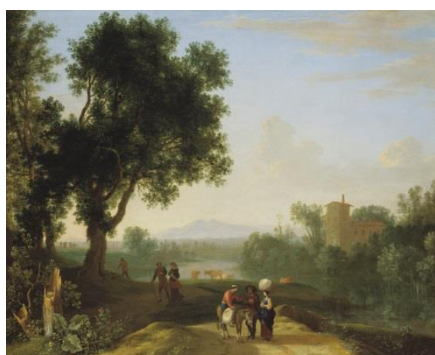
Herman van Swanevelt – Italianiserend landschap met reizigers - 1648.

18 maart tot en met 15 juli 2018 - Primavera! Nederlandse kunstenaars in Italië