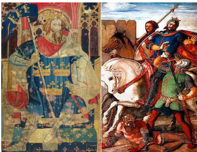
Koning Arthur (links) afgebeeld op een tapijt uit circa 1385. Rechts een afbeelding van Lancelot te paard die de gevallen Arthur bedreigt.

Voorafgaand houden wij de Algemene Ledenvergadering (Jaarvergadering), aanvang 19.30 uur .