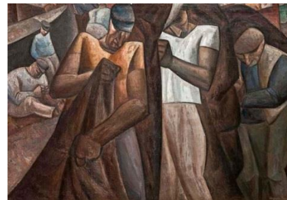
Leo Gestel – Arbeiders in de haven van Positano – 1924.

In 1924, driehonderd jaar na Swanevelt, trok Leo Gestel met zijn vrouw en een aantal schilders-vrienden door Italië. Hij verbleef op Sicilië, maar was ook geruime tijd te vinden aan de Amalfikust, waar hij prachtige tekeningen van Positano produceerde. Het stadje is tegen de rotsachtige kust gebouwd en op bijna alle werken is te zien hoe kronkelige straatjes met trappen omhoog en omlaag lopen. Anders dan veel andere kunstenaars, lijkt Gestel niet zozeer gefascineerd door het Italiaanse licht als wel door de contouren van steden en het contrast tussen de witte huizen en beschaduwde stegen.