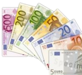
(Bron: ECB decisions ECB/2003/4 and ECB/2003/5)

De SHHV heeft, zoals eerder al gemeld, de status verworven van Culturele ANBI (Algemeen Nut Beogende Instelling), en wel met terugwerkende kracht tot 1 januari 2018. Wat zijn de (fiscale) voordelen van deze status? De volgende opsomming is niet volledig.