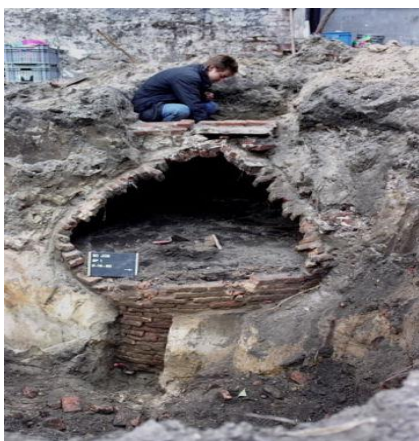
(Bakstenen beerput met koepel, opgegraven in Haarlem (1990) in de Jacobijnestraat.).

In de komende decennia staan onze steden en dorpen voor een grote verandering. Waar nu kolen, aardolie en gas de belangrijkste energiebronnen vormen, is het de bedoeling dat we overstappen naar een 'elektrische' maatschappij, gebaseerd op energiebronnen die geen broeikasgassen opleveren. Gasleidingen en benzinepompen naar het museum, en een nieuwe elektrische infrastructuur? Zulke veranderingen zijn er in het verleden ook geweest. Aan het begin van de 17e eeuw werden beerputten vervangen door stenen riolen. Tenminste, dat was de bedoeling. In Leiden pakte men het voortvarend aan, maar in Haarlem bleef voorlopig alles nog bij het oude. Waarom was dat?