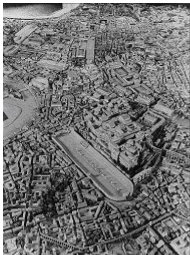
Circus Maximus in het oude Rome

Ook de provincie Utrecht is actief op dit gebied.