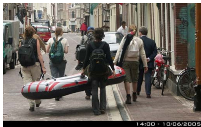
Het spoor van de Limes volgen

Er zijn zowel door het Rijk als door de provincie Utrecht diverse projecten opgezet om te bereiken dat de Limes (de Romeinse grens uit de periode 50 – 250 na Chr.) meer aandacht gaat krijgen.