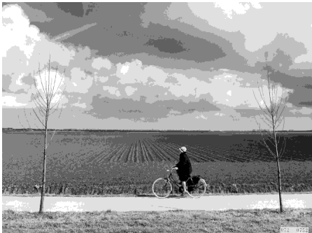
De Noordoostpolder, april 1967

door: mevrouw Linda Vlassenrood, architectuurhistoricus op: donderdag 27 oktober 2005 vanaf 20.00 uur in: het verenigingscentrum De Dam, Wilhelminaweg 79 te Woerden