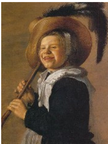
Jan Miense Molenaer (ca. 1610-1688): Meisje met blokfluit

in: het verenigingscentrum De Dam, Wilhelminaweg 79 te Woerden