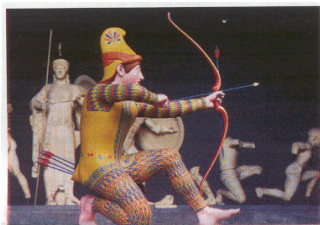
de boogschutter Paris uit de westgevel van de Aphaia-tempel.

Kleur ! bij de Grieken en de Etrusken. (2 december 2005 - 26 maart 2006)