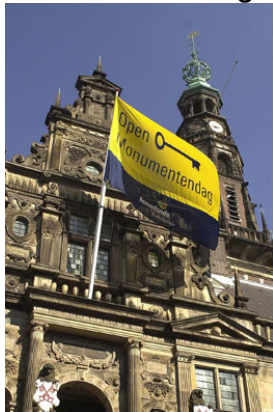
Stadhuis Leiden

Dit jaar is het thema van Open Monumentendag "Feest!" . In geheel Nederland zijn allerlei gebouwen, zoals kerken, forten en molens te bezichtigen. Voor het werkgebied van de SHHV geldt dat ook. Daarom noemen wij alleen de bijzonderheden. In Woerden is in de Bibliotheek De Beuk een fototentoonstelling ingericht over feesten in Woerden en festiviteiten in het algemeen (t/m 15 september). De start van de dag wordt muzikaal opgeluisterd door blazers op de Petrustoren.