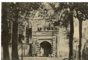
Leidsche of Rietvelder poort