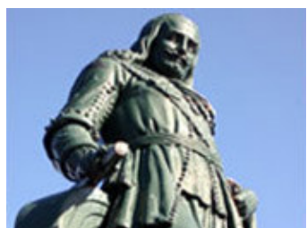
standbeeld in Vlissingen

Op 24 maart 2007 is het 400 jaar geleden dat Michiel Adriaenszoon de Ruyter in Vlissingen werd geboren. Zijn vader sjuowde biervaten in de haven van Vlissingen. Als kind moest Michiel de kost verdienen met wieldraaien bij een touwslagerij. Zijn glorieuze maritieme loopbaan van bootsjongen tot bevelhebber bracht De Ruyter de hoogste roem, adellijke titels en uiteindelijk zijn dood. Dit jaar zullen er (vooral in Vlissingen) diverse activiteiten worden ondernomen om aandacht aan deze Nederlandse held te besteden. Wist u trouwens dat hij de Nederlandse geschiedenis canon heeft gehaald? Er is ook een speciale website aan dit jubileum gewijd: www.michielderuyter.com .