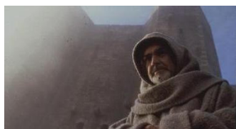
William van Baskerville