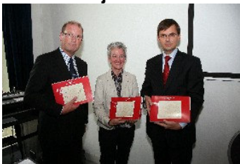
de drie eerste exemplaren

Tijdens de zeer geslaagde jubileummiddag op vrijdag 7 september jl. in het Kasteel van Woerden werd de film Woerden van Castellum tot Stad (41 na Chr. tot 1372) gepresenteerd. Een eerste exemplaar van de DVD werd aangeboden aan vertegenwoordigers van het onderwijs, het Gilde en de SHHV. De DVD zal over enige tijd ook verkrijgbaar zijn in bij onze boekentafel. Wij zullen dat aankondigen in deze nieuwsbrief.