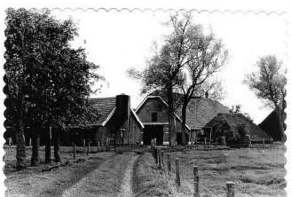
Boerderij de Lagemaat (1912) met wagenloods (1694)