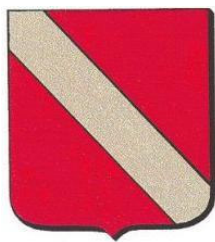
het wapen van Linschoten