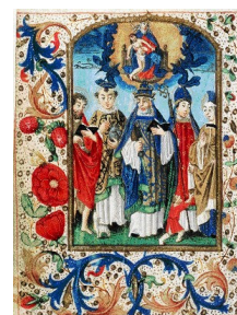
De Drie-eenheid: God de Vader met het lichaam van Christus (Not Gottes); engelen in aanbidding; St. Johannes de Doper, St. Stephanus, St. Petrus, St. Martinus, St. Maria Magdalena