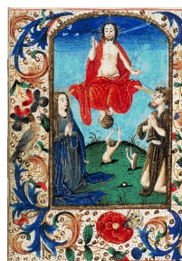
Het Laatste Oordeel: Christus op een regenboog doet de doden verrijzen, in het bijzijn van Maria en St. Johannes de Doper