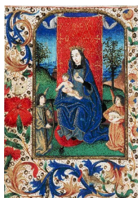
Maria met het Christus-kind, engelen houden een gordijn omhoog en spelen op luit en harpen