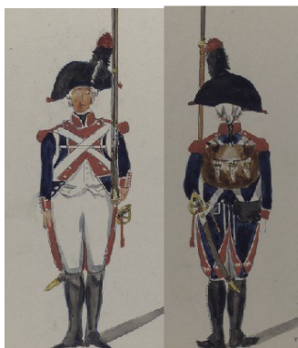
Soldaat in uniform uit 1802