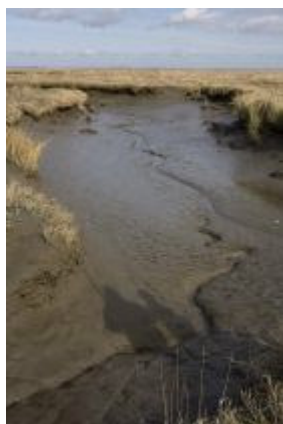
Verdronken land van Saeftinghe

Een nieuw multimediaal project over geschiedenis