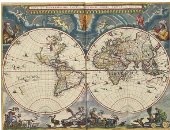
Wereldkaart in de Atlas Maior van Joan Blaeu

Tentoonstelling in Amsterdam: Atlas Maior. De wereld van Blaeu