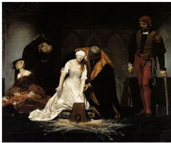
Executie van Jane Grey. Schilderij van Paul Delaroche, 1833.

op: Woensdag 8 oktober 2008 van 20.00 – 22.30 uur.