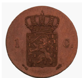
Voor- en achterzijde van de 1-centmunt uit 1817