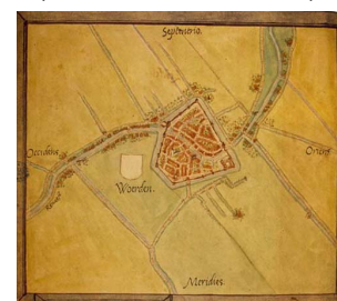
Woerden (Van Deventer, 1560)

Op 11 maart jl. heeft B&W van Woerden besloten zich in 2009 niet aan te sluiten bij de Unie van Vestingsteden (de steden die deel uitmaken van de Oude Hollandse Waterlinie, OHWL). Argument is dat er in 2009 geen dekking kan worden gevonden voor de € 1.000 die dat lidmaatschap jaarlijks kost. In 2010 wordt waarschijnlijk wel aangesloten. Eerder hebben Oudewater, Bodegraven, Schoonhoven en Nieuwpoort zich wel aangesloten en andere steden hebben het voornemen hiertoe uitgesproken.