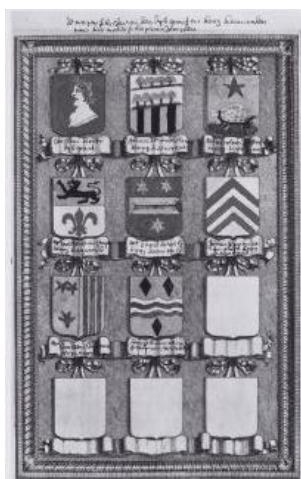
Enkele wapenschilden van Dijkgraven (ca 1730)

op: Woensdag 15 april 2009 van 20.00 - 22.00 uur.