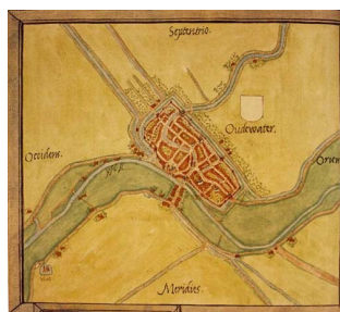
Oudewater (Van Deventer, 1560)