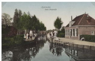
Sluis Haanwijk ca 1930

De waterschapsgeschiedenis van Harmelen is niet alleen het verhaal van droge voeten en van het bouwen van kaden en sluisen. Het is ook een politiek en een economisch verhaal, waarin grote belangen op het spel stonden.