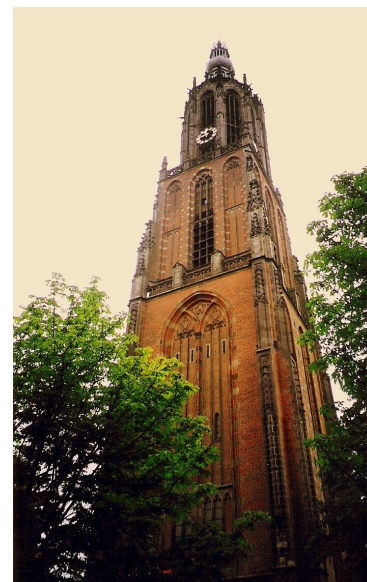
Onze Lieve Vrouwetoren

W ij hebben een bijzonder programma samengesteld, waarmee wij hopen en verwachten dat u in een dag een beeld krijgt van deze bijzondere stad.