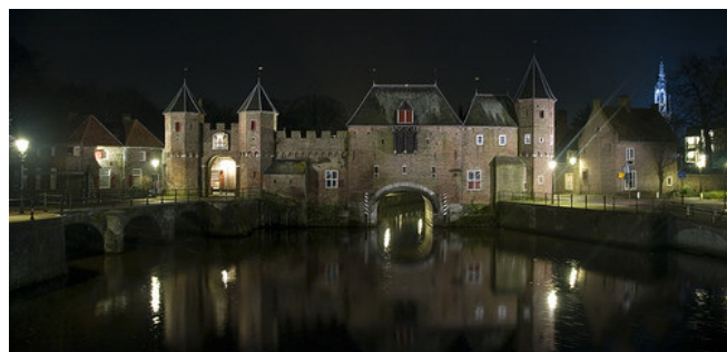
Koppelpoort bij nacht