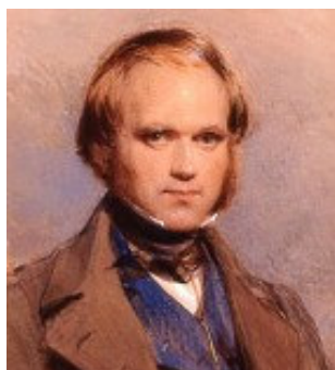
Darwin op jeugdige leeftijd