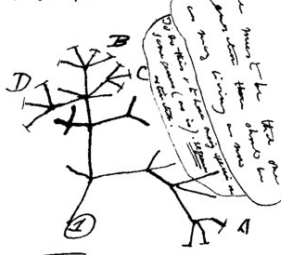
Eerste schetsje van Darwin over de evolutietheorie

op: Woensdag 7 oktober 2009 van 20.00-22.00 uur In: De Dam, Wilhelminaweg 79, 3441 XBC Woerden