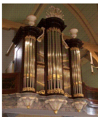
Het orgel in de Lutherse Kerk