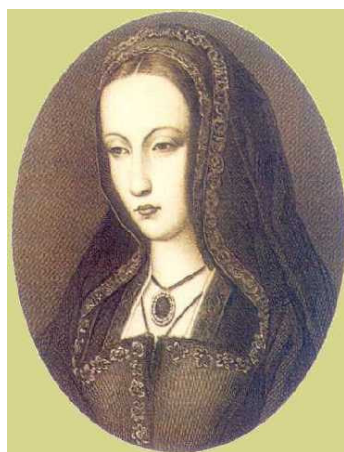
Johanna van Castilië

op: Woensdag 9 december 2009 van 20.00-22.15 uur