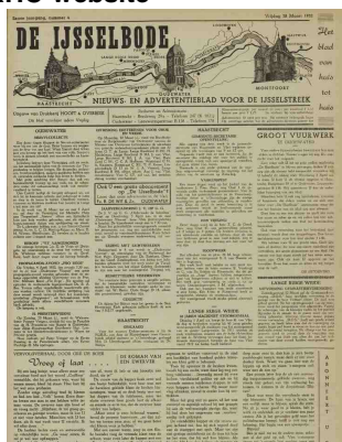
Het eerste nummer uit 1952

De IJsselbode is toegevoegd aan de kranten die op de website van RHC Rijnstreek en Lopikerwaard te raadplegen zijn. De IJsselbode is in 1952 opgericht. Vanouds rekende men de IJsselstreek tussen Haastrecht en Montfoort tot het verspreidingsgebied van de krant met in het hart daarvan Oudewater. De kranten uit de periode 1952-1999 zijn nu op de website gezet, behoudens enkele jaargangen die door brand verloren zijn gegaan.