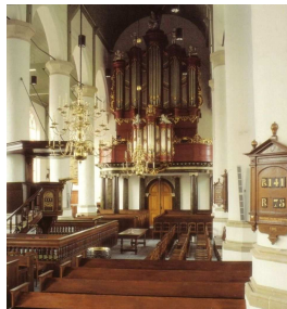
Interieur Petruskerk 1985

Nederland heeft een rijk bezit aan cultureel erfgoed. In elk dorp staat wel een kerk in het centrum of een mooie oude boerderij aan de rand. 2008 was het jaar van het Religieus Erfgoed. Dat had als doel om de belangstelling voor en de kennis van het religieus erfgoed in Nederland te vergroten. In dat jaar is ook www.reliwiki.nl gelanceerd. Een Nederlandse database met religieuze gebouwen zoals kerken, kloosters, moskeeën, synagogen en tempels. Per maand heeft de site nu ruim 26.000 bezoekers. Iedereen kan op Reliwiki informatie toevoegen of bewerken, het is namelijk gebaseerd op het wikipedia-principe. Men wil graag een zo compleet mogelijke database zijn. Over vele gebouwen is al veel bekend, maar van anderen soms alleen maar het adres. Dus als u iets over gebouwen in onze regio wilt toevoegen, schroom dan niet en deel uw kennis met anderen.