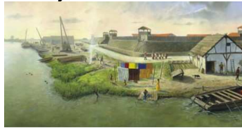
Een stukje van de muurschildering over het Romeinse dorp in het Woerdense Drive-In-Museum

Het themajaar Woerden 2010 met als onderwerp De Oude Hollandse Waterlinie loopt ten einde. We kunnen terugkijken op een zeer geslaagd jaar met een veelheid aan activiteiten. Dankzij de samenwerking tussen diverse cultuur-historische organisaties in Woerden hebben we veel kunnen organiseren. En de samenwerking wordt volgend jaar voortgezet en hopelijk ook uitgebreid. We zouden graag de jeugd ook willen laten meedoen, want geschiedenis is leuk ook voor jongeren!