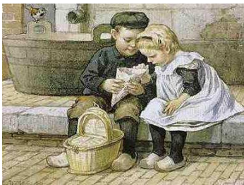
Schoolplaten van Cornelis Jetses

Op zaterdag 5 februari 2011 van 11.00 tot 16.00 uur organiseert de Stichting ABC Midden Nederland een congres met als thema schoolplaten .