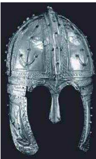
Gouden helm uit De Peel

Vloerverwarming, wegen, schrift: uitvindingen, die de Romeinen naar ons land brachten. De Nederlandse geschiedenis begint bij de Romeinen: zij schreven de oudste teksten over ons land. De eerste Romeinen die ons land bezochten, waren soldaten onder leiding van Julius Caesar.