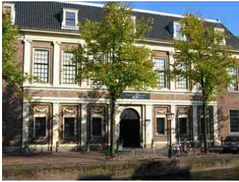
RMO, Rapenburg 28, Leiden

We verzamelen om 11.15 uur in de hal van station Woerden en reizen per trein van 12.53 uur naar Leiden. Door samen te reizen kunnen we gebruik maken van diverse kortingskaarten. De treinkaartjes (retour 2e klas met korting € 7,00) zijn voor eigen rekening. We lopen in ca. 10 minuten naar het Rijksmuseum van Oudheden aan de Rapenburg 28. De toegang tot het museum is gratis met een museumjaarkaart, 65+'ers betalen € 7,50, overige personen € 9,00. (ook de toegang is voor eigen rekening). Na aankomst is er evt. gelegenheid om koffie te drinken. Om 13.00 uur start onder begeleiding van een gids een rondleiding van een uur langs de tentoonstelling. Daarna is er ruim gelegenheid om het gebouw en de collectie verder op eigen gelegenheid te bezichtigen. We vertrekken weer om 16.00 uur en nemen de trein uit Leiden terug van 16.22 uur; we zijn dan om 16.53 uur weer in Woerden.