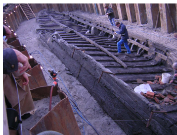
De opgraving in 2003

Zoals velen van u zullen weten is de Woerden 7, die in 2003 gevonden werd op de plaats van de huidige ingang van de parkeergarage aan de Meulmansweg in Woerden grotendeels vernield door een schimmel (zgn. witrot). Dit was vanaf de vondst al bekend, maar er bestond goede hoop dat het achterstuk bewaard zou kunnen blijven. Dat bleek veel problematischer dan gedacht, omdat bij het optillen van de resten die meteen verbrokkelden. Belangrijke delen (zoals delen van de opstaande rand met de roei-inrichting) zijn in 2003 naar het Museum für Antike Schifffahrt in Mainz (Duitsland) gebracht voor conservering. De eerste delen zijn afgelopen week terug in Nederland aangekomen en zullen eind april of begin mei geplaatst worden in een speciale vitrine in de parkeergarage (Ons Drive-In-Museum). Houdt de persberichten hierover in de gaten . Zodra er meer bekend is, zullen wij de leden via e-mail en twitter hierover berichten.