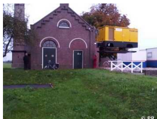
De compressor wordt geplaatst

Sinds twee jaar is er een stichting die streeft naar het weer draaiend krijgen van het gemaal Kamerik Teylingens , dat dateert uit de 19 e eeuw. De stoommachine is in de 1953 buiten gebruik gesteld en vervangen door een elektrische aandrijving. In 1988 werd een compleet nieuw elektrisch gemaal naast het oude gebouwd. Een aantal vrijwilligers besteedt menig zaterdag aan het restaureren van het oude gemaal, zodat het op termijn weer echt op stoom kan draaien. Daarvoor zal echter nog veel werk moeten worden verzet en er zal ook nog geld nodig zijn. Eerder al maakten wij melding dat het gemaal weer mechanisch in beweging was gezet, maar nu heeft het voor het eerst op perslucht gedraaid. U kunt hier het filmpje bekijken dat daarvan gemaakt is. Eerdere interviews en filmpjes kunt u vinden op onze website www.shhv.info onder Beeld en Geluid .