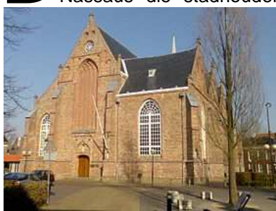
Grote of Jacobijnerkerk

Koning-Stadhouder Willem III bij zijn overlijden in 1702 geen wettige opvolger had, stierf de Bredase tak van Willem van Oranje uit en ging het huis van Oranje-Nassau verder in de zogenaamde Friese tak, de nazaten van Willems broer Jan VI van Nassau-Dillenburg. Van het verblijf van de Nassaus is ook nog veel in de stad terug te vinden, waaronder het huis van de regentes Maria Louise van Hessen-Kassel, waarin nu een porseleïnmuseum is gevestigd.