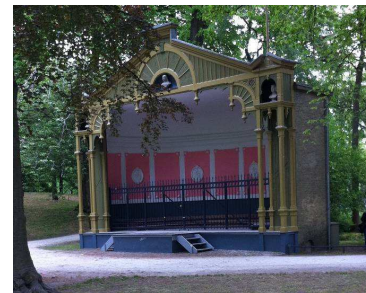
Muziektent De Koperen Tuin

10.00 Aankomst in Leeuwarden bij Restaurant de Koperen Tuin. In het Restaurant de Koperen Tuin worden we ontvangen met koffie/thee en gebak.